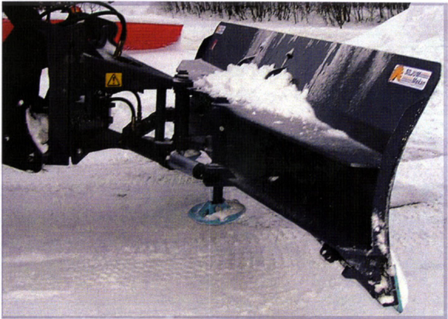
Diagonalplog sedd från sidan: Angreppsvinkel 15 grader.